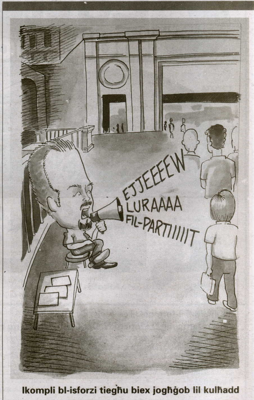
Ikompli bl-isforzi tiegħu biex jogħġob lil kulhadd

Bil-GAG, il-volontarjat Għawdxu lahaq livelli godda ta' maturità. Issa jrid jasal biex jagħti sehemu fl-iżvilupp tal-gżira.