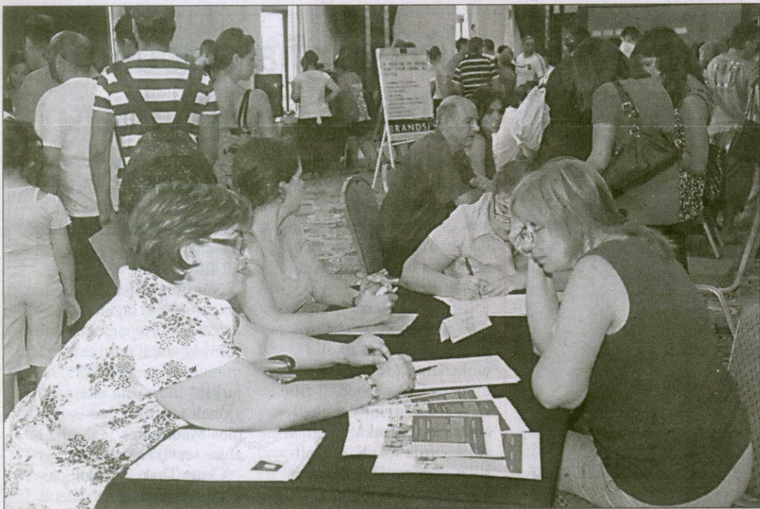
Dawk li attendew għal din il-fiera tal-ETC kellhom iċ-ċans isiru jafu bl-opportunitajiet tax-xogħol li joffri s-suq bħalissa